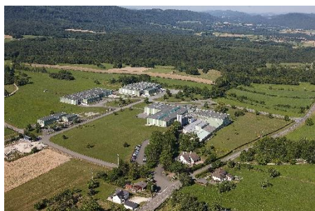
Delfingen – Site d'Anteuil (25)