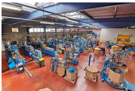
Delfingen – Site d'Anteuil (25)