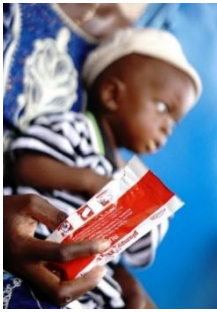
Les produits développés par Nutriset, tel que Plumpy'Nut®, font référence dans les programmes de prise en charge de la malnutrition dans le monde