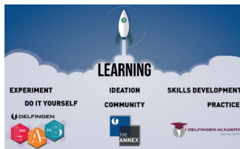
Delfingen – Synopsis du projet RH

Le projet de transformation de l'entreprise repose sur une approche pragmatique s'intégrant dans les processus d'excellence opérationnelle du groupe avec 3 piliers : la liberté d'initiative des collaborateurs, comme moteur de l'innovation au sein de l'entreprise ; une collaboration étroite avec l'écosystème pour gagner en agilité, frugalité et créativité et un système d'information ouvert, intégrateur, scalable, favorisant la convergence IT-OT.