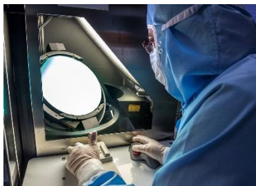
Soitec – Inspection visuelle