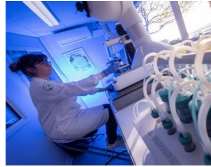
Analyses des produits finis Nutriset

Dans le contexte particulier de l'urgence humanitaire, qui est soumis à une demande chaotique difficilement prévisible et qui nécessite l'assurance de la disponibilité permanente de produits périssables, Nutriset est un partenaire incontournable des Nations-Unies, des gouvernements et des organisations non-gouvernementales qui œuvrent sur le terrain auprès des populations vulnérables.