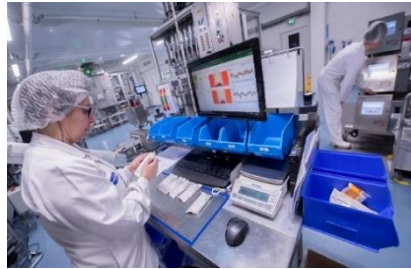
Le site de Nutriset en France a une forte flexibilité de taux de charge pour répondre très rapidement aux urgences humanitaires.