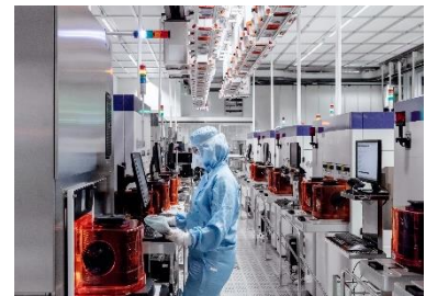
Soitec - Atelier métrologie Bernin

Le procédé d'amincissement chimique du substrat FD-SOI est le fruit d'un co-développement breveté avec un équipementier majeur du semi-conducteur et le CEA-Leti. Le projet labellisé concerne l'ensemble des moyens innovants de traitement et stockage des données, analyses statistiques, boucle d'asservissement, dispositifs de contrôle et de pilotage mis en œuvre et qui ont permis l'industrialisation de la production de ce produit complexe.